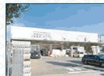
建デポ 八王子大和田店 徒歩約38分 / 車約10分