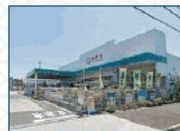
エムハート&グリーン日野新町店 徒歩約17分 / 車約5分