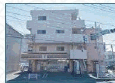
セブンイレブン 日野大阪上店 徒歩約3分 / 車約2分